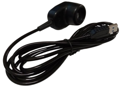
Lector óptico USB A (Imagen 3)

Imagen 1. Muestra el lector óptico ADS-40-1 con su frente ANSI tipo II.