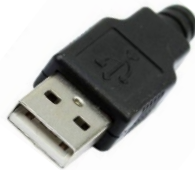
Conector USB A (Imagen 2)