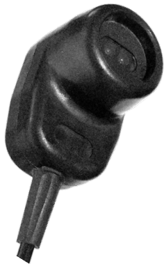
Cabezal de Lector (Imagen 1)